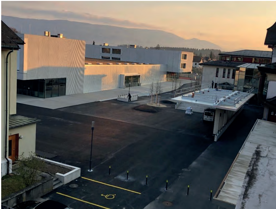
Derendingen Mitte (Bilder vom 15. April und 5. Mai 2021)