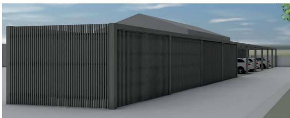
Eingangsplatz und Vorplatz Wollturm

Zur Erstellung der Baute wird neu der Baubereich F geschaffen.